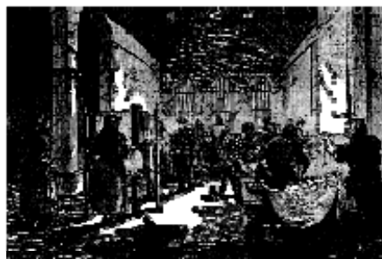
"Y golchdy a'r ystafell smwddio yng Ngharchar Brixton."

(Criminal Prisons in London and Scenes of Prison Life gan H. Mayhew a J. Binny, cyhoeddwyd gyntaf yn 1862.)