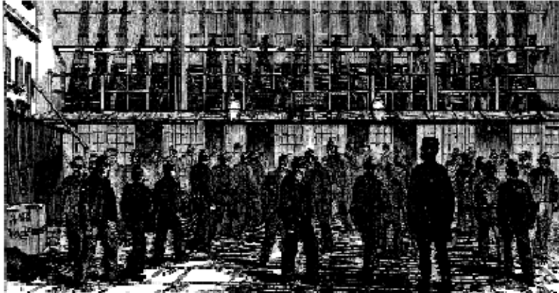
"Carcharorion yn gweithio ar y felin droed ac eraill yn ymarfer... yng Ngharchar y Crwydriaid, Coldbath Fields."

Roedd cynlluniau gwaith y carchar yn galed a llym. Roedd y felin draed, gwehyddu, gwau a thorri cerrig yn weithgareddau cyffredin