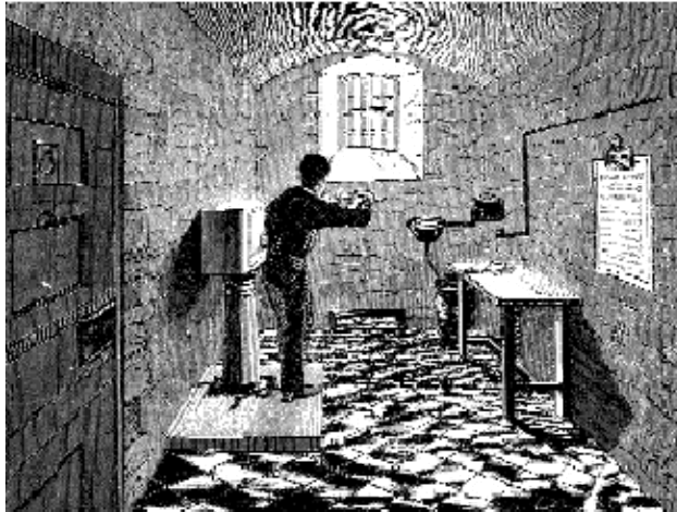
"Carcharor yn troi'r cranc llaw."

Dim ond i un cyfeiriad yr oedd dolen y cranc llaw yn troi a gellid gosod y mecanwaith cyfrif yn ôl i sero gan wardeniaid y tu allan i'r gell. Gyda rhai modelau roedd cwpanau'n codi tywod o flwch, yn ei gludo i ben yr olwyn, lle roedd yn disgyn yn ôl i'r blwch gwaelod. Gydag eraill roedd y gwasgedd ar olwyn ffrithiant yn cael ei reoli gan y wardeiniaid (a gafodd eu llysenwi'n "screws") a oedd yn addasu'r pwysau neu'n tynhau'r cogiau wrth iddynt weithio'n rhydd. Roedd y peiriannau diweddarach yn rheoleiddio'r mecanwaith eu hunain.