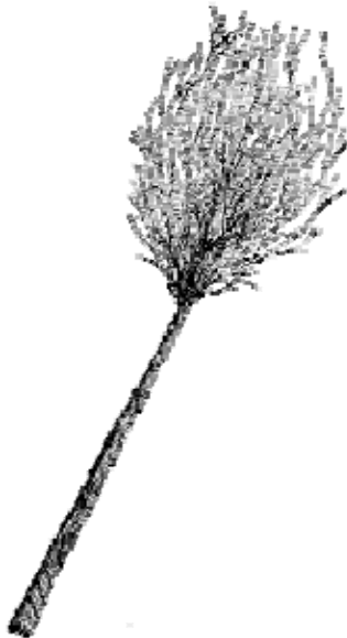
WHIP, OR ROD, WANDSWORTH.

Weithiau roedd y ddisgyblaeth yn fwy llym. Yn 1848 adroddodd yr Arolygwr Carchardai fod y carcharorion yn parhau yn eu gwelyau am 7.30am pan ddylent fod wedi codi am 6am, nid oedd y rheol dim siarad yn cael ei gweithredu, ac er bod ysmegu'n waharddedig "there was a smell of tobacco in one of the principal day-rooms". Ni ddarllenwyd gweddiâu dyddiol ac ni wnaeth y llywodraethwr gyflwyno adroddiad ynghylch ymosodiad ar warden gan garcharor meddw. Wedi i'r adroddiad argymhell y dylid ei ddiswyddo, ymddiswyddodd y llywodraethwr.