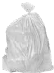
Sach wen untro