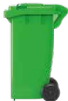
Bin ar olwynion gwyrdd

Cysylltwch â ni i gofrestru ar gyfer y gwasanaeth casgliadau taladwy hwn