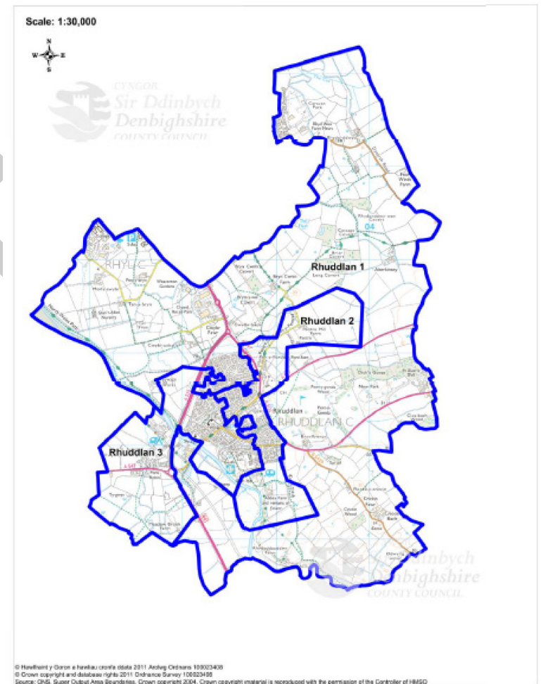
Map yn dangos Ardaloedd Cynnyrch Ehangach Is yn Rhuddlan

Yn rhifyn 2011 y Mynegai, rhoddwyd dosbarthiad is na'r flwyddyn flaenorol i bob ardal ac eithrio Rhuddlan 2. Gydag incwm isel y gwelwyd y symudiad mwyaf i fyny yn y "parthau" sy'n ffurfio'r Mynegai ar gyfer yr ardal arbennig yma ac yna ddiweithdra ac iechyd.