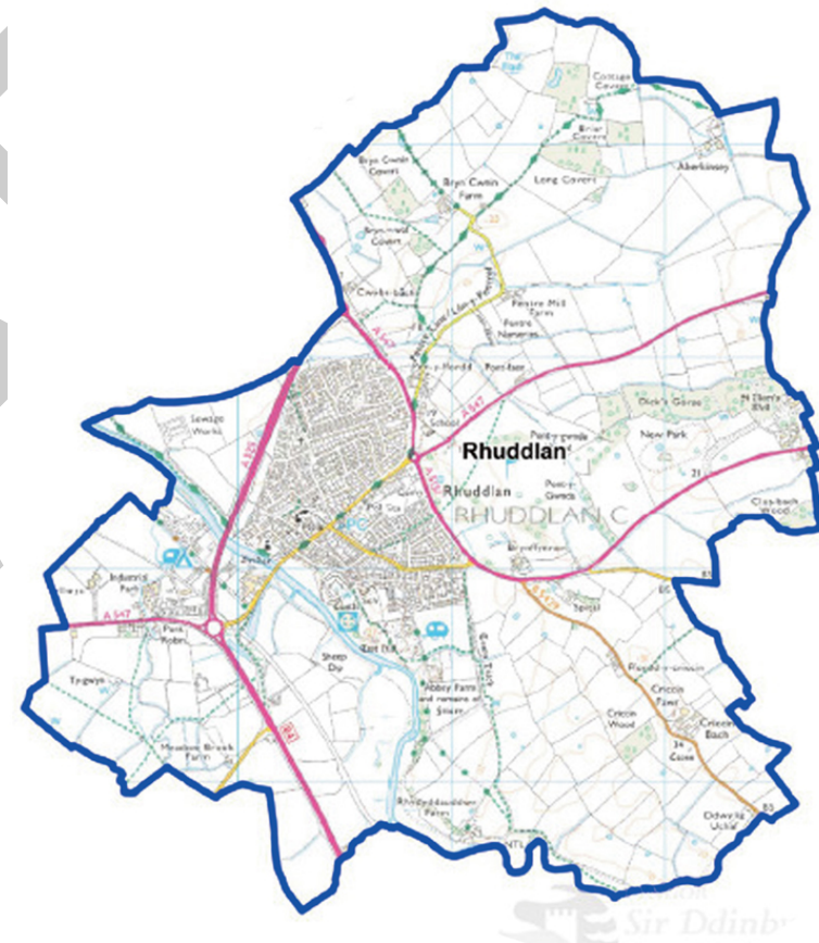
Map yn dangos y wardiau yn Ardal Rhuddlan