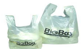
Bagiau gwastraff bwyd wedi eu prynu o'r Archfarchnad

PWYSIG - NI chaiff eich cadï ei wagio os byddwch yn defnyddio bagiau eraill ar wahân i'r rhai a ddarparwyd gan Gyngor Sir Ddinbych.