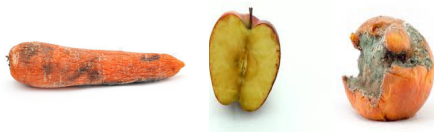
Peelings and rotten vegetables