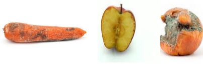
Croen llysiâu a llysiâu wedi llwydo