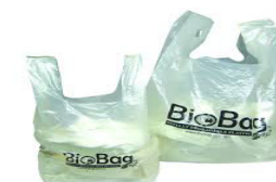
Supermarket bought biobags

IMPORTANT: If your caddy contains bags other than those supplied by Denbighshire County Council, then your caddy will NOT be emptied.