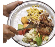
Bwyd dros ben