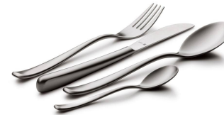
Cyllyll, ffyrç neu llwyau